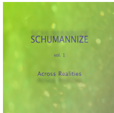
Schumannize Vol. 1 – Across Realities (Cattitude Records EFCR-2015-1)

In dieser Reihe markiert SCHUMANNIZE für Mischa Schumann eine Plattform, auf der er inhaltlich und personell flexibel im Sinne von „work in progress“ konzeptionell arbeiten kann.